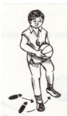
Fig. 2 - Pé de pivô

Um jogador que recebe a bola quando está parado ou parando e receber a bola está autorizado a fazer a jogada de pivô.