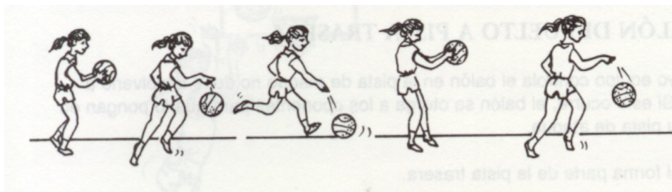
Figura 3: Exemplo de infração - A jogadora para e recomeça a driblar

Progredir com a bola fora destes limites é uma violação e a posse de bola será concedida à equipe adversária.